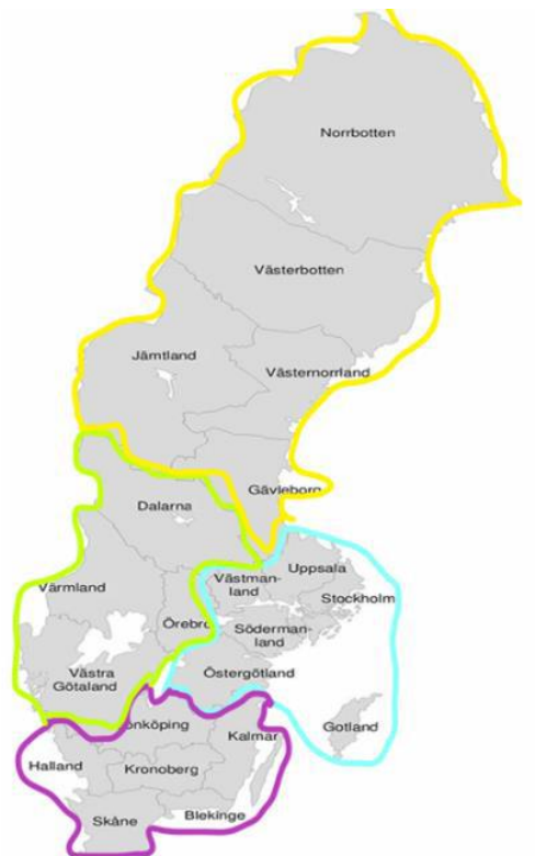
Figur 1 Nätverket är indelat i fyra geografiska noder.

Det länsstyrelsegemensamma nätverket utgör navet i arbetet med uppdraget i mänskliga rättigheter. Under året har nätverket träffats fysiskt två gånger och digitalt två gånger. Utöver detta har ett flertal digitala erfarenhetsutbyten i samverkan med andra länsstyrelseuppdrag erbjudits.